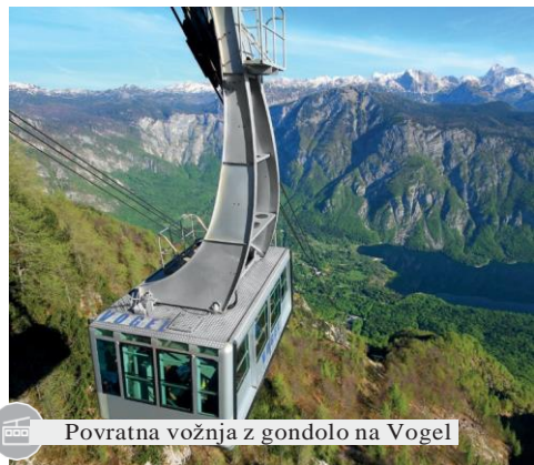
Povratna vožnja z gondolo na Vogel