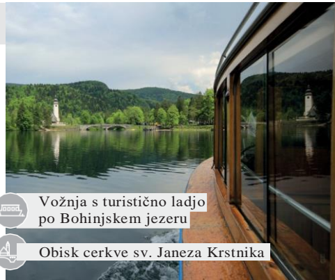
Vožnja s turistično ladjo po Bohinjskem jezeru