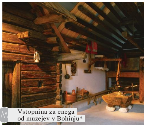
Vstopnina za enega od muzejev v Bohinju*