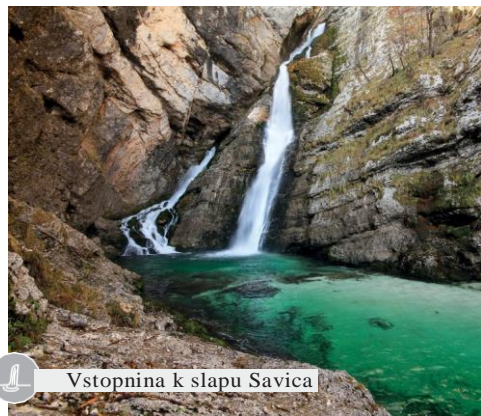
Vstopnina k slapu Savica

Za otroke do 6. leta so storitve v paketu (razen gostinskih storitev) brezplačne.