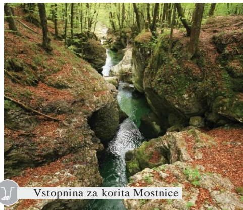
Vstopnina za korita Mostnice